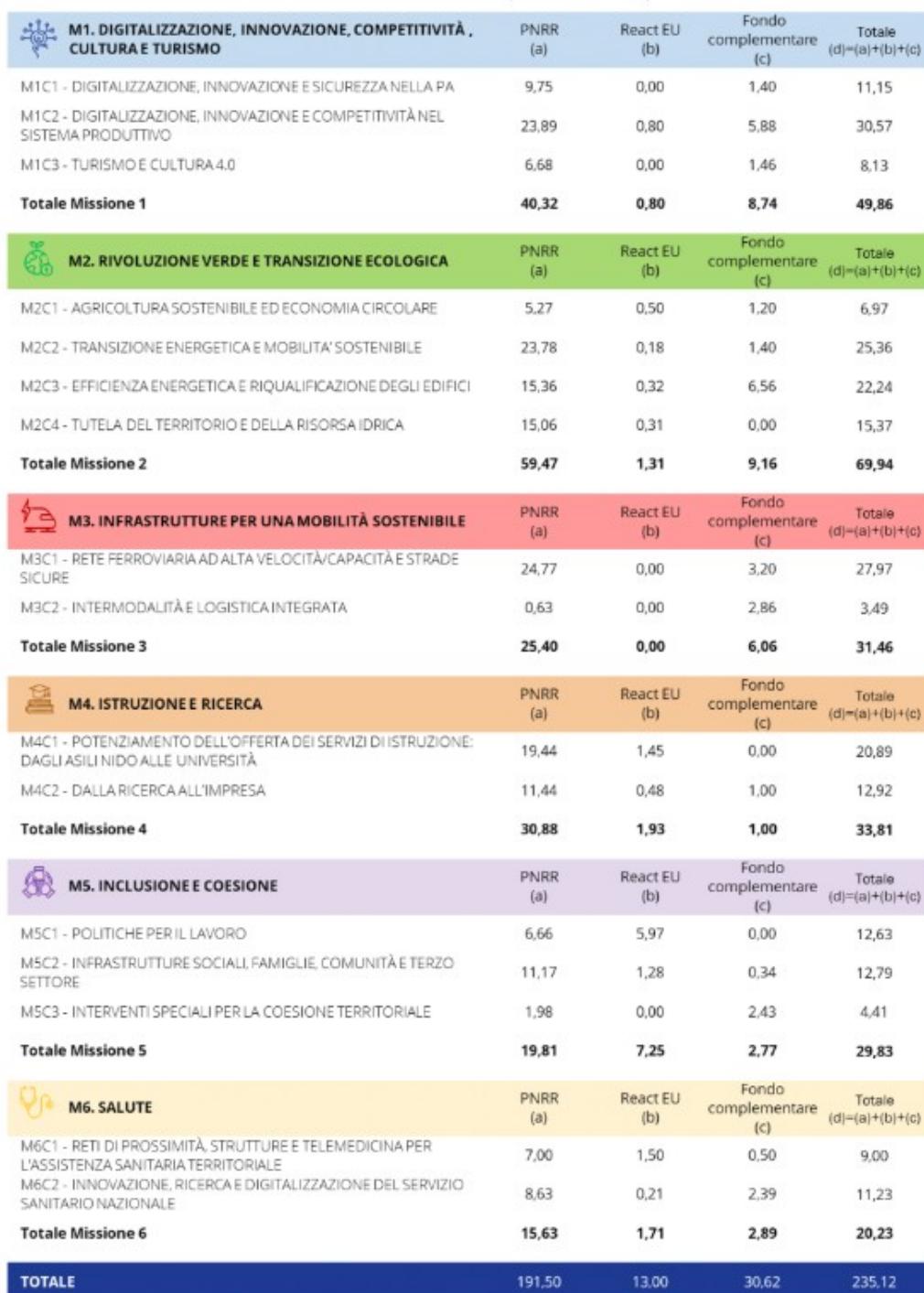
TAVOLA 1.1: COMPOSIZIONE DEL PNRR PER MISSIONI E COMPONENTI (MILIARDI DI EURO)

Un ulteriore riferimento per gli indirizzi e obiettivi strategici è rappresentato dal Piano nazionale di Ripresa e resilienza che orienta l'azione dell'amministrazione sempre in un'ottica di valore pubblico, il PNRR si sviluppa intorno a tre assi strategici condivisi a livello europeo, ovvero digitalizzazione, transizione ecologica, inclusione sociale, e si articola in 16 Componenti, raggruppate in sei Missioni: Digitalizzazione, Innovazione, Competitività, Cultura e Turismo; Rivoluzione Verde e Transizione Ecologica; Infrastrutture per una Mobilità Sostenibile; Istruzione e Ricerca; Inclusione e Coesione; Salute: